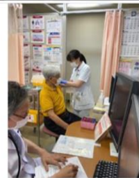
診察・・・医師が予診票やカルテを確認し、接種可否を判断します。

当診療所では、重症化リスクを考慮し、高齢で基礎疾患がある方から順に接種を予定させていただいております。この日、接種に来られた方は全部で36名、平均年齢は91.3歳。最高齢の方は101歳でした！皆さん、体調管理を心掛け、また忘れ物もなく全員無事接種することができました。