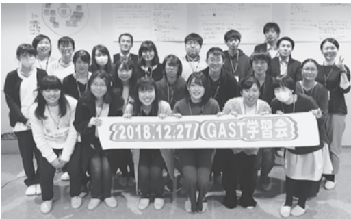
医系学生学習企画 (ガスト) にて