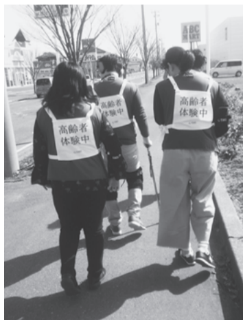
高齢者疑似体験で、体験学習の様子

2つ目に医系学生学習企画GAST(ガスト)です。これは医学生や薬学生など他学部の学生とともに学ぶことと