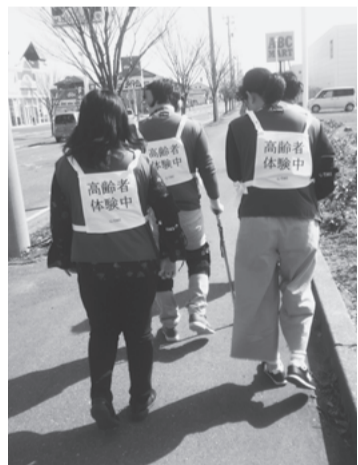
高齢者疑似体験で、体験学習の様子

2つ目に医系学生学習企画GAST(ガスト)です。これは医学生や薬学生など他学部の学生とともに学ぶことと