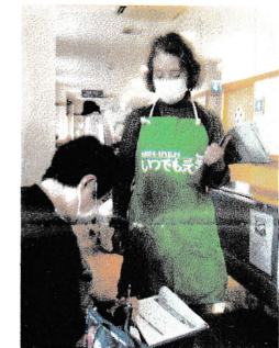
舟江診療所外来コーナー

健康友の会では秋の一件増やし月間(9~11月)がとりくまれ、各総支部で特色を活かした活動が行われています。健康チェックをはじめました。健康チャレンジの申込みは10月末で終了。健康友の会の会員増やし地域協同基金の増額運動、医療・介護、社会保障の充実を求める署名など、この機会にご協力をお願いいたします。