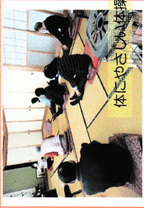
体にやさしい体操