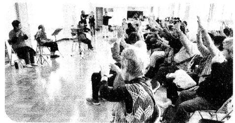
『ウサギ追いし彼の山』…『ふるさと』の振り付けをリード

友の会会員が大活躍のまつりでした。階段や廊下のそこそこで知り合い同士話し合う姿や、エレベーター前のベンチに腰掛けて、おこわとキノコ汁を食べながらおしゃべりする人達もいて、開会の区長メッセージでもふれられていた「フレイル予防の3本の柱の一つ、社会参加」のいい機会にも