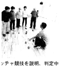
ボッチャ競技を説明、判定中

「ボッチャ」というパラリンピックの公式競技も体験しました。離れた所からの(まど)近くへ玉(お手玉)のような皮製の物を寄せるゲームです。カーリングのボール版のような競技で、身体にも優しく誰でも楽しめます。「来年には支部対抗戦がやれたらいいね」と参加者からの声も出ました。皆さんも支部、班でウォームの体験会はいかがですか。友の会事務局へご相談ください。