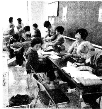
2時間で60人が健康チェック

10月20日、北部総合コミュニティセンターで第17回舟江健康まつりが開催され、だれもが安心して暮らし続けられる「医療と福祉のまちづくり」を「テーマ」に、450人が集いました。