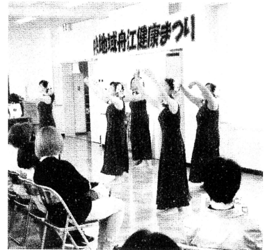
新婦人のフラダンス小組、フラ・ハイビスカスの皆さん